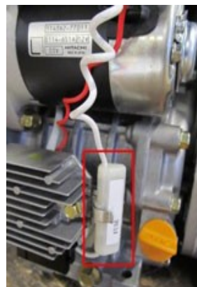
Предохранитель электрической цепи стартера