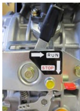
Ручка-переключатель «RUN-STOP» в в положении «РАБОТА»