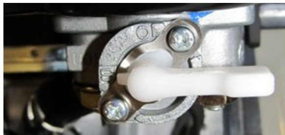
Топливный кран закрыт